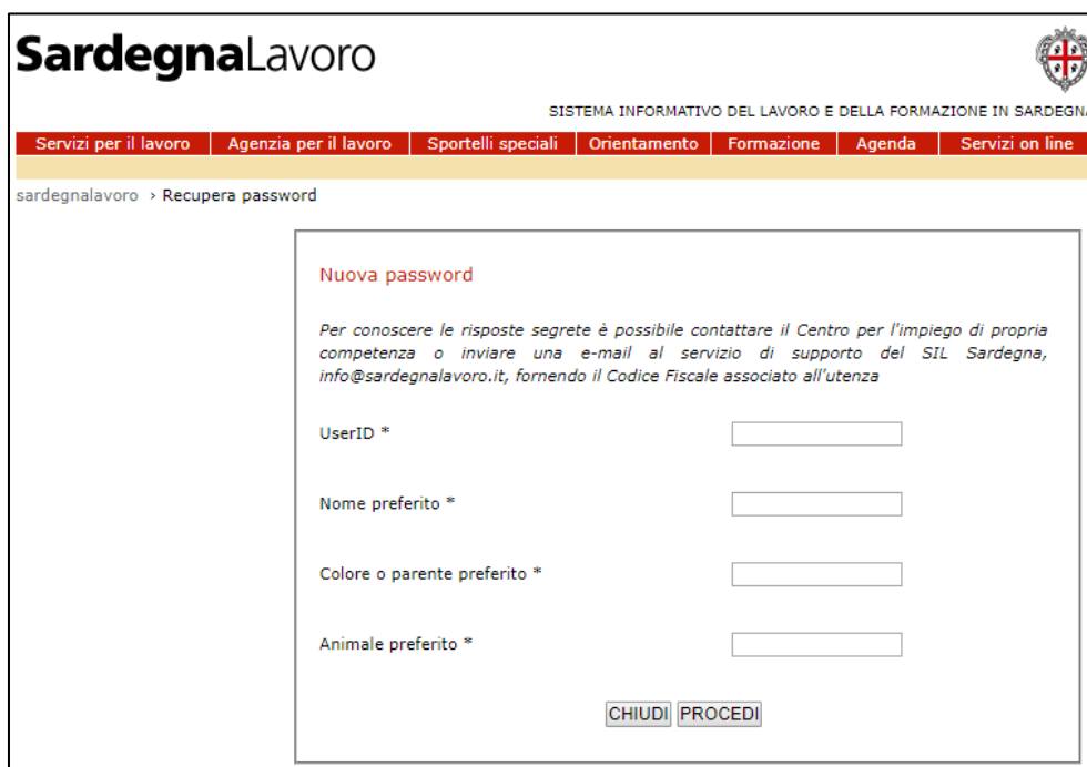
Figura 8: "Maschera Nuova password"

Rispetto a quanto descritto nel paragrafo 1.1.2, esiste la possibilità per l'utente di recuperare la password anche attraverso l'inserimento della UserID e delle risposte segrete. A tale servizio si accede selezionando il pulsante "INSERISCI RISPOSTE SEGRETE" (Figura 5). A seguito della selezione di tale pulsante il sistema visualizza la maschera riportata nella figura successiva: