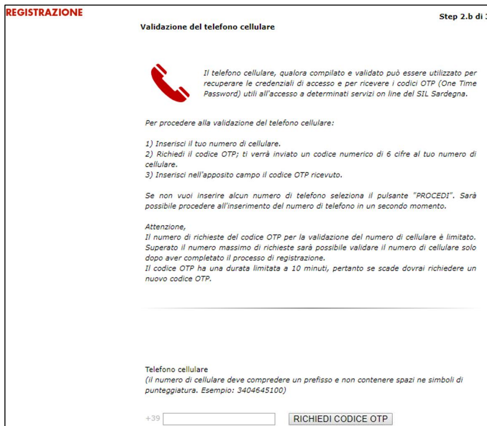
Figura 11: "Maschera Validazione del telefono cellulare"

Successivamente alla validazione dell'indirizzo di posta elettronica, è possibile procedere con la validazione del contatto telefonico, così come rappresentato nella figura sottostante: