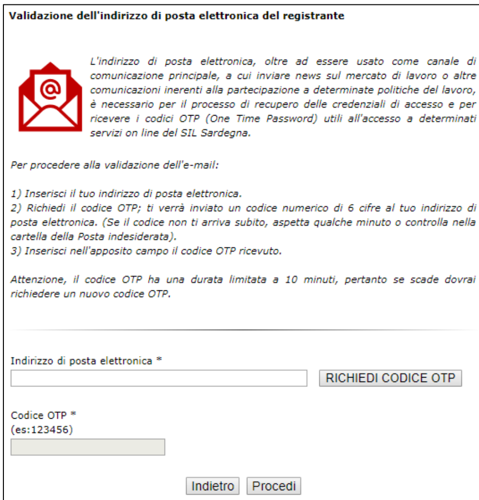
Figura 13: "Maschera validazione dell'indirizzo di posta elettronica dell'utente"

Vademecum per l'accesso ai Servizi Online