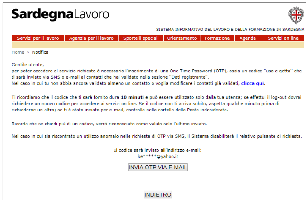
Figura 17: "Invio codice OTP all'indirizzo e-mail indicato"

Vademecum per l'accesso ai Servizi Online